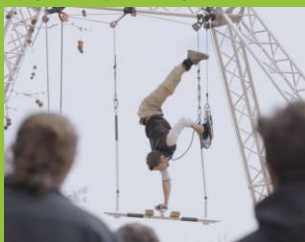
PÍFIA (Cirque / Clown)